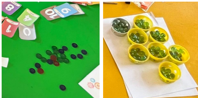
Gambar 1. Media Kancing dan Kelereng serta Kartu Angka

Gambar diatas menunjukkan media yang digunakan untuk mengenal angka dimana setiap benda merepresentasikan angka. Analisis data menunjukkan bahwa enam dari tujuh siswa berhasil mengidentifikasi dan menghitung dengan tepat jumlah kancing dan kelereng yang ditunjukkan pada hasil evaluasi pada LKPD. Hasil ini mendukung penelitian sebelumnya yang menunjukkan bahwa penggunaan alat peraga konkret dapat meningkatkan motivasi siswa dalam belajar matematika, terutama bagi mereka yang mengalami kesulitan belajar (Devi et al., 2022; Safitri, 2018; Wulandari & Prasetyaningrum, 2018) Data ini menunjukkan bahwa meskipun mayoritas siswa mampu mengenali angka dasar, masih terdapat satu siswa yang memerlukan pendekatan lebih lanjut dalam pengajaran.