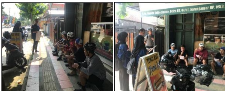
Gambar 2. Pelaksanaan kegiatan edukasi

Hasil di atas merupakan presentase hasil pemahaman peserta terhadap DOMS. Dapat diketahui peningkatan pemahaman meningkat sebesar 56% atau sebanyak 6 dari 7 peserta mendapatkan hasil yang baik (>50%). Evaluasi yang telah dilakukan penulis menunjukkan bahwa kegiatan edukasi memiliki dampak yang cukup baik terhadap pengetahuan peserta tentang defenisi, gejala, dan cara mengatasi DOMS. Sebagian peserta telah banyak yang benar dan paham yang dilihat dari hasil post test yang telah diberikan. Hal ini menunjukkan bahwa kegiatan pengabdian masyarakat dapat diterima dengan baik oleh peserta.