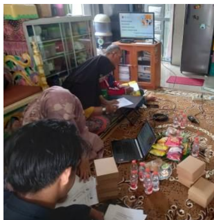
Gambar 5. Penyelesaian kasus sederhana oleh mitra

Pada tahapan ini mitra diberikan sebuah kasus sederhana yang relevan dengan usaha ternak ayam. Selama mengerjakan kasus tersebut, peserta didampingi oleh tim pengabdian. Pada tahapan ini pula dilakukan evaluasi pemahaman mitra terkait dengan pengelolaan keuangan pada usaha ternak (Gambar 5). Evaluasi ini diberikan untuk mengetahui sejauh mana pemahaman mitra terhadap materi yang disampaikan oleh narasumber.