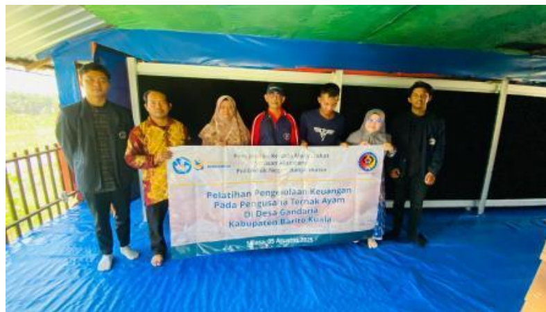
Gambar 4. Kunjungan ke lokasi kandang ayam mitra (lantai atas)