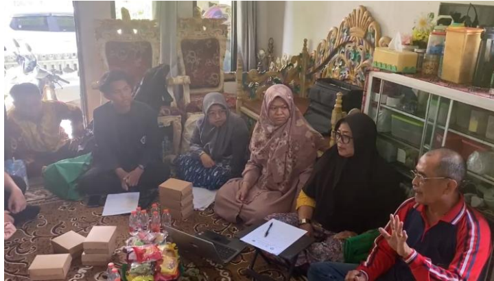
Gambar 6. Diskusi dan Tanya Jawab

Pada tahapan ini, mitra berdiskusi, tanya jawab dan saling sharing pengalaman terkait dengan pengelolaan keuangan yang selama ini dilakukan, kendala yang dihadapi dan penyimpangan – penyimpangan yang pernah dilakukan oleh karyawannya (Gambar 6). Penyimpangan yang dilakukan oleh karyawannya dikarenakan kurangnya pengawasan terhadap pencatatan ketika pakan ternak masuk dan ketika pakan ternak digunakan, sehingga terjadi selisih jumlah pakan yang tersisa di gudang.