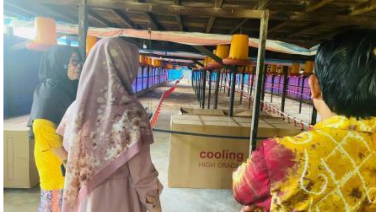
Gambar 3. Kunjungan ke lokasi kandang ayam mitra (lantai bawah)