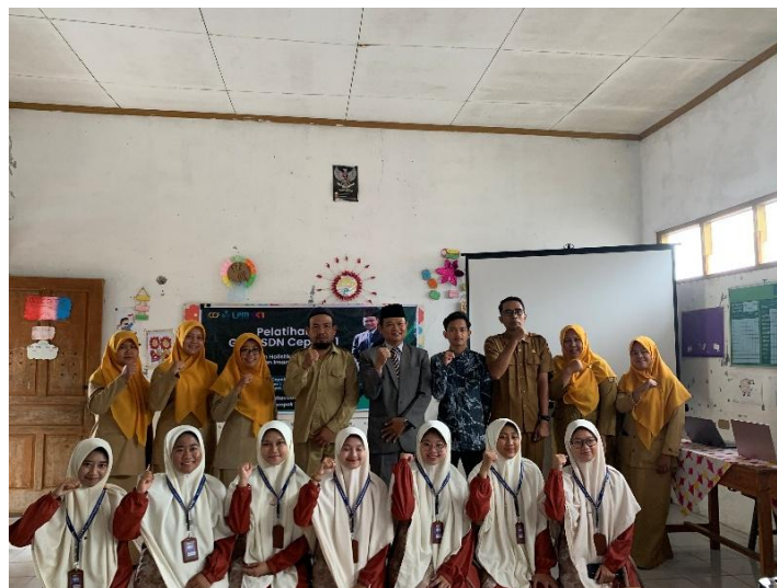
Gambar 7. Sesi Perfotoan Bersama Pada Akhir Kegiatan

Secara keseluruhan, kegiatan pengabdian ini tidak hanya meningkatkan kapasitas pemahaman konseptual guru, tetapi juga menghasilkan model pendidikan yang dapat diterapkan secara berkelanjutan. Model tersebut menekankan tiga aspek utama: (1) penguatan landasan filosofis pendidikan Islam, (2) integrasi nilai spiritual dalam setiap pembelajaran, dan (3) pembiasaan akhlak melalui kultur sekolah. Dengan demikian, pelatihan ini berkontribusi dalam membangun paradigma pendidikan yang