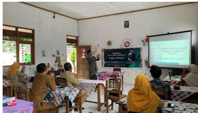
Gambar 5. Diskusi bersama antara tim pengabdian UNIDA Gontor dan guru SDN Cepoko 1

Diskusi interaktif menjadi ruang refleksi bersama untuk mengaitkan materi pelajaran umum dengan nilai ketuhanan, pembiasaan adab, serta penguatan kesadaran spiritual peserta didik. Guru secara aktif menyampaikan pengalaman mengajar, tantangan yang dihadapi, serta alternatif solusi berbasis konsep pendidikan Imam Al-Ghazali. Proses ini memperlihatkan terjadinya dialog dua arah yang konstruktif antara tim pengabdian UNIDA Gontor dan pihak sekolah SDN Cepoko 1.