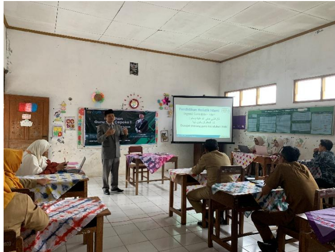
Gambar 4. Penyampaian materi pendidikan holistik Islami menurut Imam Al-Ghazali

Diskusi interaktif menjadi ruang refleksi bersama untuk mengaitkan materi pelajaran umum dengan nilai ketuhanan, pembiasaan adab, serta penguatan kesadaran spiritual peserta didik. Guru secara aktif menyampaikan pengalaman mengajar, tantangan yang dihadapi, serta alternatif solusi berbasis konsep pendidikan Imam Al-Ghazali. Proses ini memperlihatkan terjadinya dialog dua arah yang konstruktif antara tim pengabdian UNIDA Gontor dan pihak sekolah SDN Cepoko 1.