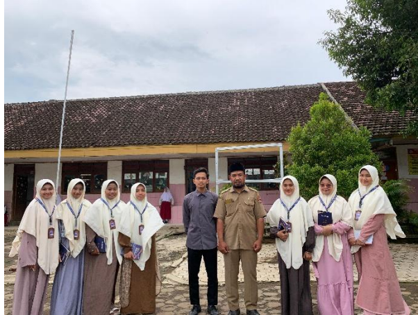
Gambar 2. Kegiatan koordinasi dan observasi awal bersama guru SDN Cepoko 1

Tahap pelaksanaan dilakukan pada hari Selasa, 24 Februari 2026. Penyampaian materi konseptual mengenai pendidikan holistik Islami menurut Imam Al- Ghazali memberikan landasan filosofis sekaligus praktis bagi guru. Konsep integrasi antara ilmu, amal, dan ibadah dipahami bukan sekadar teori normatif, tetapi sebagai kerangka dasar pendidikan yang perlu dihayati dan diwujudkan dalam setiap aktivitas pembelajaran. Pemaparan mengenai tazkiyatun nafs (penyucian jiwa) dan tahdzib al-akhlaq (pembinaan akhlak) mendorong guru untuk merefleksikan kembali orientasi pembelajaran yang selama ini dijalankan.