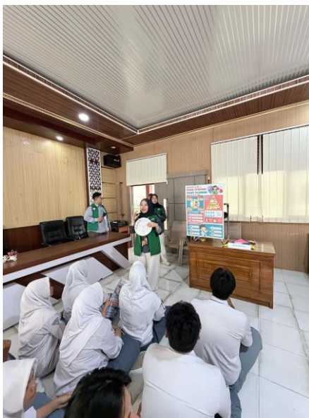
Gambar 2. Edukasi di Booth Kesehatan

Pada aspek smart reproducing , poster menekankan pentingnya menjaga kebersihan dan kesehatan organ reproduksi. Edukasi yang diberikan meliputi anjuran untuk mengganti pakaian dalam minimal dua kali sehari, menggunakan bahan yang mampu menyerap keringat, serta menjaga kebersihan dengan menggunakan handuk yang bersih. Selain itu, poster juga memuat pesan promotif dan preventif berupa ajakan untuk menghindari perilaku berisiko, seperti merokok, konsumsi alkohol, dan penyalahgunaan narkoba, serta menunda hubungan seksual sebelum menikah.