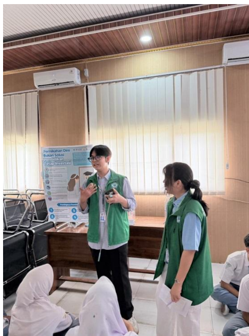
Gambar 6. Kegiatan Edukasi Booth Pendidikan

Selain memaparkan risiko, poster juga menekankan pentingnya pendidikan sebagai investasi masa depan. Edukasi yang disampaikan meliputi peningkatan pemahaman siswa mengenai risiko pernikahan dini, pentingnya kesiapan fisik, mental, dan ekonomi sebelum menikah, serta dorongan untuk menyelesaikan pendidikan dan merencanakan masa depan secara matang. Poster juga bertujuan membentuk sikap tanggung jawab peserta dalam mengambil keputusan terkait kehidupan pribadi.