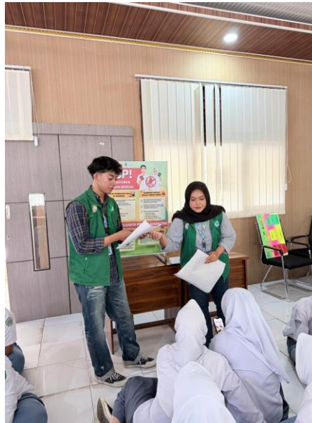
Gambar 4. Kegiatan Edukasi Booth Hukum

syarat dan tanpa dispensasi dapat menimbulkan permasalahan hukum terkait pencatatan dan status perkawinan.