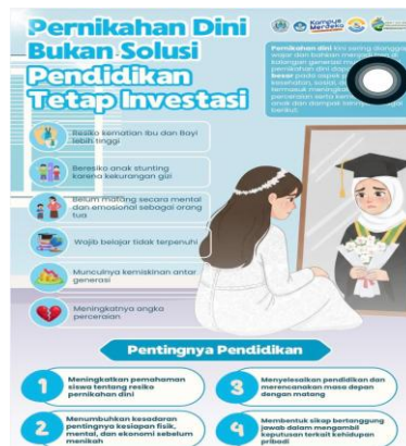
Gambar 5. Poster Edukasi Booth Pendidikan

Kegiatan pada booth hukum juga dilengkapi dengan games edukatif yang disesuaikan dengan materi pada poster. Dalam pelaksanaan games, peserta menunjukkan antusiasme yang tinggi dan mampu mengikuti alur permainan dengan baik. Sebagian besar peserta dapat menjawab pertanyaan yang berkaitan dengan materi pernikahan dini dan kekerasan seksual secara tepat, yang menunjukkan adanya pemahaman terhadap informasi yang telah disampaikan.