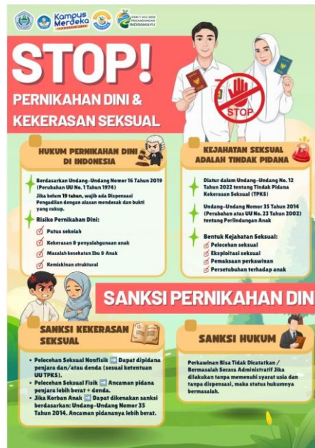
Gambar 3. Poster Edukasi Booth Hukum

menunjukkan bahwa metode edukasi yang dikombinasikan dengan permainan tidak hanya meningkatkan keterlibatan peserta, tetapi juga membantu memperkuat pemahaman mereka terhadap materi yang telah disampaikan.