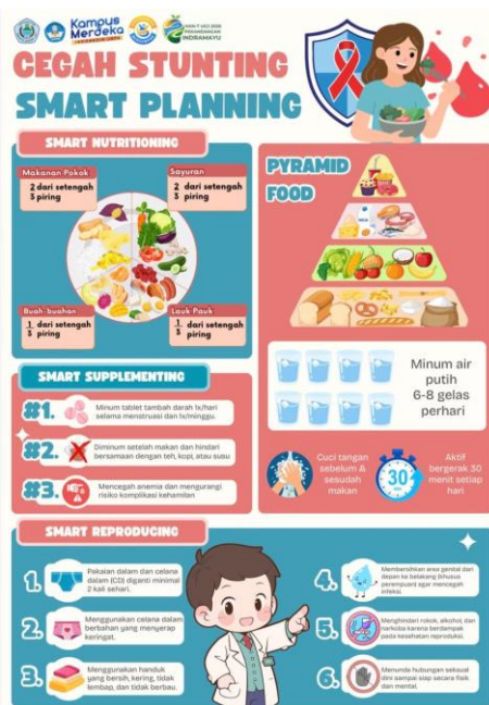
Gambar 1. Poster Edukasi Booth Kesehatan

Pelaksanaan kegiatan edukasi dilakukan melalui metode berbasis booth yang terdiri dari booth kesehatan, booth hukum, dan booth pendidikan. Setiap booth menyajikan materi edukasi menggunakan media poster serta dilengkapi dengan games interaktif yang bertujuan untuk meningkatkan keterlibatan peserta.