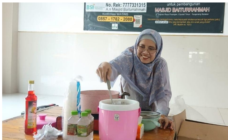
Gambar 3. Proses Pembuatan Minuman Lidah Buaya