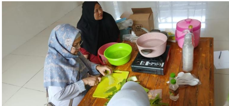
Gambar 2. Pengolahan Bahan Lidah Buaya

Pada tahap pelaksanaan, kegiatan pelatihan dan demonstrasi berjalan dengan baik dan menunjukkan tingkat partisipasi yang tinggi dari peserta. Berdasarkan hasil observasi selama kegiatan berlangsung, peserta terlibat aktif dalam setiap tahapan proses produksi minuman lidah buaya, mulai dari pemilihan bahan baku, proses pencucian dan perendaman untuk mengurangi lendir, perebusan, hingga pencampuran dengan bahan tambahan seperti gula dan perisa alami. Peserta juga dilatih dalam teknik pengemasan sederhana yang higienis dan menarik, sebagai salah satu faktor penting dalam meningkatkan nilai jual produk. Keterlibatan langsung peserta dalam praktik ini menunjukkan bahwa pendekatan pembelajaran berbasis praktik lebih efektif dalam meningkatkan pemahaman dan keterampilan dibandingkan dengan metode ceramah semata.