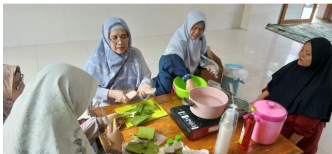
Gambar 4. Praktik Pembuatan Minuman Lidah Buaya Bersama Jamaah

Hasil wawancara dengan peserta setelah kegiatan pelatihan menunjukkan bahwa mereka memperoleh pengetahuan baru yang sebelumnya belum dimiliki, terutama terkait teknik pengolahan lidah buaya yang benar dan aman untuk dikonsumsi. Peserta juga menyampaikan bahwa kegiatan ini memberikan inspirasi untuk memanfaatkan bahan yang sebelumnya kurang dimanfaatkan menjadi produk yang memiliki nilai ekonomi. Beberapa peserta mengungkapkan ketertarikan untuk mencoba memproduksi minuman lidah buaya secara mandiri di rumah, baik untuk konsumsi keluarga maupun untuk dijual dalam skala kecil. Hal ini menunjukkan adanya perubahan sikap dan motivasi peserta ke arah yang lebih produktif.