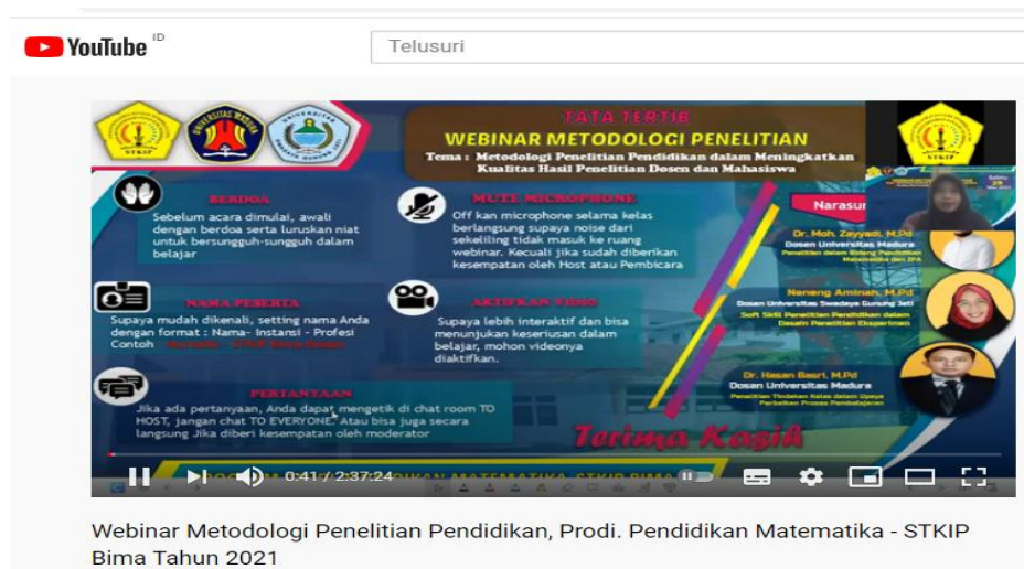
Gambar 3. Tampilan chanel youtube kegiatan webinar metodologi penelitian

Publikasi dan penyebarluasan informasi kegiatan webinar dilakukan dengan menyebarkan flayer melalui media social Whatsshap, Telegram, Facebook dan Instagram. Hasil rekaman pelaksanaan dan dapat ditonton ulang melalui chanel youtube Syarif Leu pada link https://www.youtube.com/watch?v=sKx9BSsK7QM