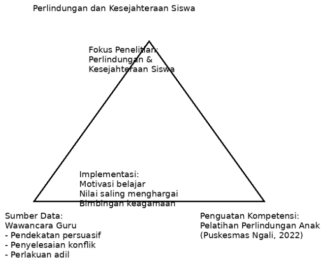
Gambar 2. Hasil Triangulasi Wawancara Guru terkait Student Well Being