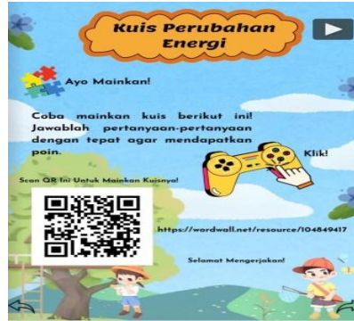
Gambar 5. Kuis menggunakan permainan berbantuan website dalam E-Modul Berbasis Deep Learning IPAS