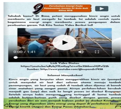
Gambar 4. Materi Kegiatan Lokal Tentang Transformasi Energi berbasis Deep Learning IPAS