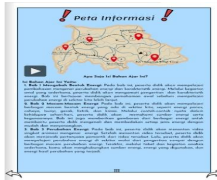
Gambar 3. Peta Informasi Untuk E-Modul Berbasis Deep Learning IPAS