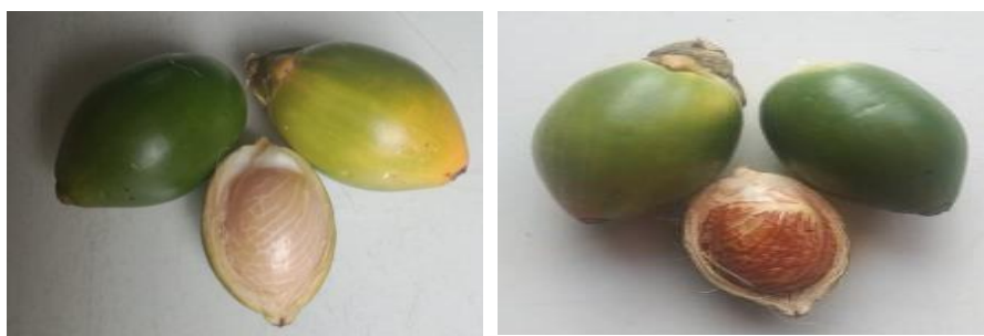
Gambar 3. Kondisi Buah Pinang

Penerapan e-modul berbasis etnosains Papua terbukti memberikan kontribusi signifikan terhadap peningkatan keterampilan proses sains peserta didik karena mampu mentransformasi materi redoks yang abstrak menjadi fenomena konkret melalui pengamatan perubahan warna pada buah pinang ( Areca catechu ). Secara