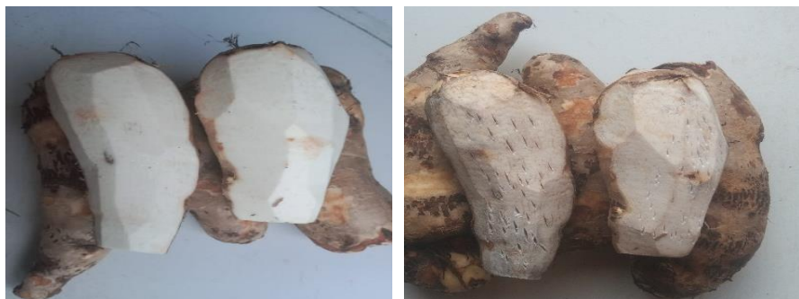
Gambar 2. Kondisi Keladi

Berdasarkan Gambar 2, secara kimiawi ketika keladi khas Papua yang mengandung senyawa polifenol terpapar oksigen ( O_2 ) setelah dikupas, maka enzim polifenol oksidase bertindak sebagai katalis yang menyebabkan oksidasi senyawa fenolik menjadi kuinon. Peristiwa ini kemudian berpolimerisasi menjadi pigmen melanin berwarna cokelat. Melalui pengamatan langsung terhadap peran oksigen sebagai oksidator pada kearifan lokal ini. Peserta didik tidak hanya memahami konsep transfer elektron secara teoretis, tetapi juga mampu mengaitkan ilmu kimia dengan realitas kehidupan dan budaya di lingkungan sekitar mereka. Selain keladi, reaksi reduksi-oksidasi (redoks) dapat diamati secara jelas pada kearifan lokal Papua buang pinang yang ditunjukkan Gambar 3 berikut: