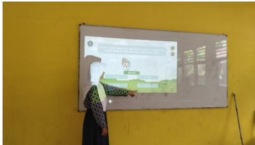
Gambar 2. Pembelajaran dikelas

Selain itu, dalam proses pembelajaran siswa diarahkan untuk menjawab kuis yang ditampilkan di depan kelas melalui media PPT+AR. Setiap jawaban yang diberikan siswa langsung memperoleh feedback otomatis dari media, baik berupa konfirmasi jawaban benar maupun penjelasan singkat terkait kesalahan yang dilakukan. Pemberian feedback secara langsung tersebut membantu siswa mengetahui letak kesalahan dan memperbaiki pemahamannya saat proses pembelajaran berlangsung. Hal ini menunjukkan bahwa penggunaan media PPT+AR tidak hanya membantu siswa memahami konsep melalui visualisasi, tetapi juga melatih siswa untuk melakukan evaluasi terhadap pemahamannya sendiri secara langsung.