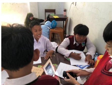
Gambar 2. Kegiatan eksperimen cahaya dipantulkan

Pada pelaksanaan Siklus I, metode eksperimen mulai diimplementasikan secara sistematis dalam kegiatan belajar di kelas. Peserta didik difasilitasi untuk berpartisipasi secara langsung dalam rangkaian percobaan sederhana sehingga pemahaman konsep dapat dikonstruksi melalui pengalaman empiris yang bersifat nyata. Selama kegiatan belajar berjalan, terindikasi adanya kecenderungan eskalasi keterlibatan peserta didik.