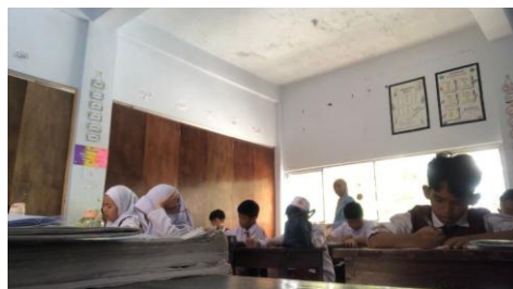
Gambar 2. Mengerjakan soal prasiklus