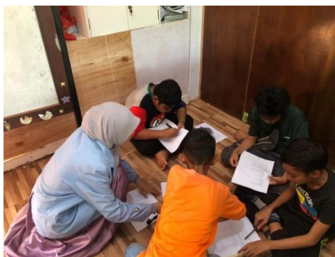
Gambar 3. Guru menjelaskan cara melakukan eksperimen

Siklus II dalam penelitian ini diimplementasikan pada tanggal 27 dan 29 April 2026 di Sekolah Dasar Alam Muara Bungo dengan intensitas dua kali pertemuan, masing-masing berdurasi 2 \times 30 menit sesuai ketentuan alokasi waktu pembelajaran. Pada fase ini, prosedur penelitian tetap mengacu pada kerangka Penelitian Tindakan Kelas (PTK) yang bersifat siklikal dan reflektif, yang mencakup tahapan perencanaan (planning), tindakan (action), observasi (observing), serta refleksi (reflecting) yang dilaksanakan secara sistematis dan berkesinambungan. Adapun implementasi tindakan pada siklus ini merupakan hasil derivasi reflektif dari Siklus I, yang difokuskan pada optimalisasi keterlibatan aktif peserta didik, penyempurnaan instruksi prosedural eksperimen, serta intensifikasi peran pedagogis guru dalam memberikan scaffolding selama kegiatan belajar berjalan.