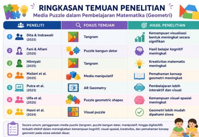
Gambar 6. Sintesis Temuan Utama Penelitian

Analisis lebih lanjut menunjukkan bahwa media puzzle manipulatif memberikan dampak positif yang konsisten terhadap visualisasi geometris, pemahaman konsep, dan hasil belajar matematika pada berbagai jenjang kelas sekolah dasar. (Fani dkk., 2025) membuktikan bahwa penggunaan puzzle bangun datar menghasilkan peningkatan hasil belajar yang lebih unggul dibandingkan pembelajaran konvensional, mengindikasikan keunggulan pendekatan berbasis manipulasi konkret. Temuan tersebut selaras dengan teori belajar aktif yang menyatakan bahwa keterlibatan langsung siswa dalam proses pembelajaran mampu meningkatkan retensi dan pemahaman konsep secara lebih mendalam (Bonwell & Eison, 1991). (Dita & Indrawati, 2023) menjelaskan bahwa media tangram secara khusus membantu siswa memahami konsep geometri melalui aktivitas rotasi, refleksi, dan penyusunan pola secara visual dan eksploratif. (Putra dkk., 2023) menambahkan bahwa teknologi augmented reality geometry menciptakan pengalaman belajar yang lebih imersif dan interaktif, sehingga siswa lebih mudah memahami hubungan spasial bangun datar secara dinamis. Integrasi teknologi tersebut memperlihatkan bahwa media puzzle terus berkembang dari bentuk manipulatif tradisional menuju media digital interaktif yang relevan dengan tuntutan pembelajaran abad ke-21.