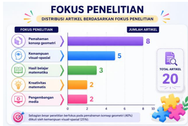
Gambar 4. Distribusi Artikel Berdasarkan Fokus Penelitian

visualisasi melalui dekomposisi dan rekonstruksi bangun datar, sedangkan (Hasni dkk., 2024) menunjukkan bahwa visual puzzle berbasis persepsi visual berdampak signifikan terhadap kemampuan siswa mengidentifikasi bentuk geometris. Temuan-temuan tersebut memperlihatkan bahwa media puzzle manipulatif berpotensi multidimensional, tidak hanya meningkatkan hasil belajar tetapi juga mengembangkan kemampuan visual-spasial siswa secara lebih komprehensif.