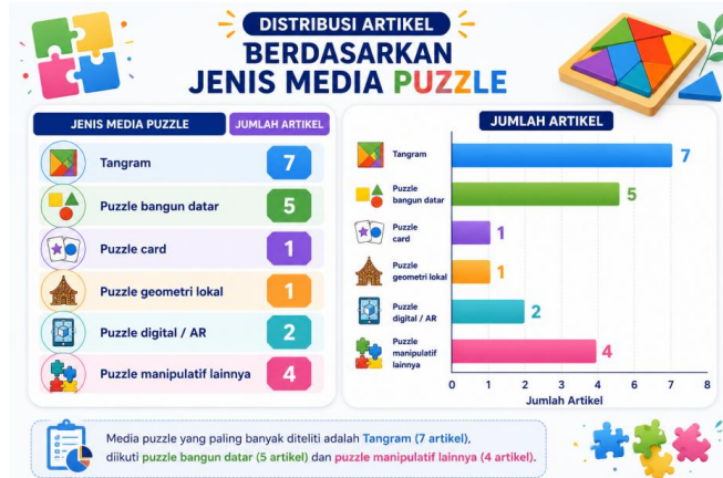
Gambar 5. Jenis Media Puzzle yang Digunakan dalam Penelitian

Analisis lebih lanjut menunjukkan bahwa media puzzle manipulatif memberikan dampak positif yang konsisten terhadap visualisasi geometris, pemahaman konsep, dan hasil belajar matematika pada berbagai jenjang kelas sekolah dasar. (Fani dkk., 2025) membuktikan bahwa penggunaan puzzle bangun datar menghasilkan peningkatan hasil belajar yang lebih unggul dibandingkan pembelajaran konvensional, mengindikasikan keunggulan pendekatan berbasis manipulasi konkret. Temuan tersebut selaras dengan teori belajar aktif yang menyatakan bahwa keterlibatan langsung siswa dalam proses pembelajaran mampu meningkatkan retensi dan pemahaman konsep secara lebih mendalam (Bonwell & Eison, 1991). (Dita & Indrawati, 2023) menjelaskan bahwa media tangram secara khusus membantu siswa memahami konsep geometri melalui aktivitas rotasi, refleksi, dan penyusunan pola secara visual dan eksploratif. (Putra dkk., 2023) menambahkan bahwa teknologi augmented reality geometry menciptakan pengalaman belajar yang lebih imersif dan interaktif, sehingga siswa lebih mudah memahami hubungan spasial bangun datar secara dinamis. Integrasi teknologi tersebut memperlihatkan bahwa media puzzle terus berkembang dari bentuk manipulatif tradisional menuju media digital interaktif yang relevan dengan tuntutan pembelajaran abad ke-21.