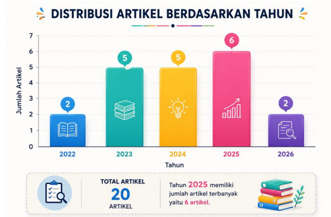
Gambar 2. Distribusi Artikel Berdasarkan Tahun Publikasi

Mayoritas penelitian dilakukan pada siswa kelas II hingga kelas V sekolah dasar yang berada pada fase operasional konkret, di mana siswa membutuhkan media visual dan manipulatif untuk memahami konsep abstrak matematika secara bermakna (Piaget, 1981), sejalan dengan teori representasi (Bruner, 1974) bahwa pemahaman konsep geometri lebih efektif melalui tahapan enaktif dan ikonik sebelum simbolik. (Ulfa dkk., 2025) membuktikan bahwa geometric shapes puzzle meningkatkan kemampuan visual-spasial melalui aktivitas penyusunan bentuk dan rotasi objek, sementara (Mailani dkk., 2025) menambahkan bahwa media manipulatif menciptakan pengalaman belajar aktif yang memudahkan siswa memahami hubungan antarbangun datar. Beberapa penelitian bahkan melibatkan guru sebagai subjek pelatihan, yang mengindikasikan bahwa keberhasilan implementasi media puzzle turut ditentukan oleh kompetensi pedagogis guru dalam merancang aktivitas pembelajaran geometri secara efektif dan terstruktur.