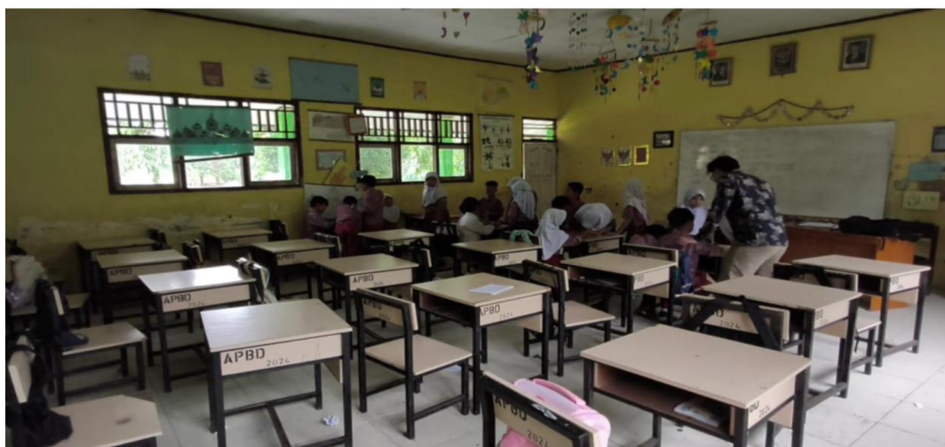
Gambar 4. Proses Pembelajaran Siklus II

Implementasi pembelajaran pada Siklus II dilaksanakan secara sistematis merujuk pada rancangan perbaikan yang telah disusun berdasarkan hasil refleksi siklus sebelumnya. Pembelajaran terbagi ke dalam dua kali pertemuan dengan alokasi waktu 4 x 35 menit. Proses pembelajaran dilakukan dengan menerapkan langkah-langkah Model Teams Games Tournament (TGT) secara lebih optimal, dengan mengintegrasikan penguatan manajerial kelompok heterogen ( teams ) dan penertiban regulasi permainan akademik ( games ) untuk memperkuat pemahaman konsep matematika peserta didik.