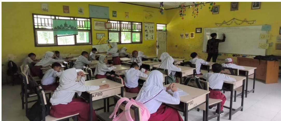
Gambar 3. Proses Pembelajaran Siklus I

Implementasi pembelajaran pada Siklus I dilaksanakan secara sistematis merujuk pada rancangan yang telah disusun, yang terbagi ke dalam dua kali pertemuan dengan alokasi waktu 4 x 35 menit. Proses pembelajaran dilakukan dengan menerapkan langkah-langkah Model Teams Games Tournament (TGT), yang mengawali setiap tahapan belajar melalui penyampaian materi pokok matematika secara klasikal ( class presentation ), dilanjutkan dengan kerja kelompok heterogen ( teams ), serta pelaksanaan permainan akademik ( games ) dan kompetisi di meja turnamen ( tournament ).