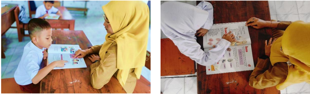
Gambar 1. Implementasi Program Fokus Baca

Kegiatan membaca selama 15 menit dapat meningkatkan keterampilan membaca siswa. Berdasarkan hasil wawancara, program ini bisa membantu siswa yang belum lancar dalam membaca agar menjadi lebih baik. Program ini bisa memfasilitasi siswa di kelas bawah yang belum ahli membaca untuk belajar dengan lebih cepat. Melalui kegiatan tersebut, kepala sekolah berharap bisa memacu motivasi siswa untuk belajar, dimulai dari keinginan membaca. Siswa akan mengembangkan kebiasaan baik ketika mereka melakukan aktivitas secara teratur. Kebiasaan ini akan tumbuh dalam diri mereka secara otomatis (Khusna et al., 2022).