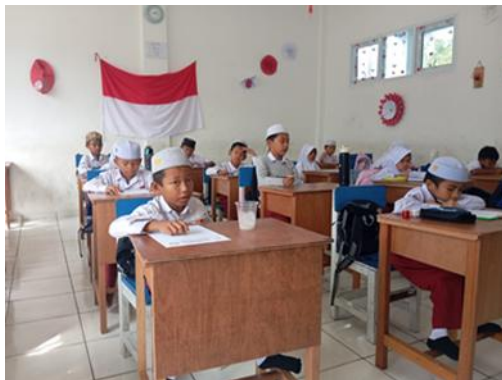
Gambar 3. Pelaksanaan Ujian Akhir Semester Ganjil secara tertulis.

dominan pada tes formatif dan sumatif menjadi lebih autentik, termasuk penggunaan observasi sikap dan penilaian kinerja.