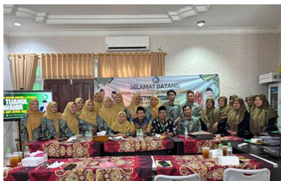
Gambar 5. Studi Tiru ke sekolah MI Asy-Syifa Balikpapan

“Sebagai Kepala Madrasah, kami berperan dalam memberikan arahan, supervisi, dan motivasi kepada guru. Kami juga memfasilitasi pelatihan, yang menyediakan perangkat evaluasi yang memadai, serta melakukan monitoring dan evaluasi terhadap pelaksanaan penilaian agar berjalan sesuai standar.” (Kepala Madrasah).