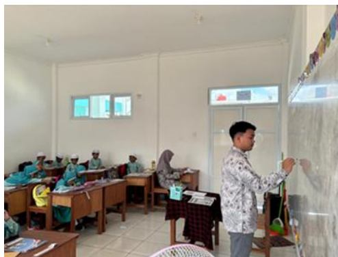
Gambar 4. Pembelajaran Fiqih sekaligus Monitoring Guru oleh kepala sekolah

Hasil wawancara juga mengungkap bahwa pemahaman guru terhadap evaluasi pembelajaran dipengaruhi oleh pendidikan, pelatihan, pengalaman mengajar, dan pedoman kurikulum. Guru yang memiliki pengalaman dan pelatihan lebih banyak cenderung lebih memahami cara mengevaluasi siswa secara baik. Selain itu, lingkungan sekolah juga ikut memengaruhi, khususnya melalui kebijakan sekolah, budaya religius, dan dukungan kepala madrasah.