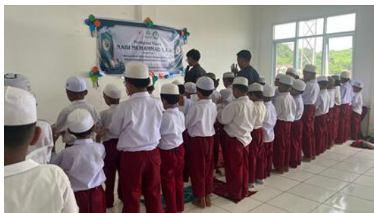
Gambar 2. Pelaksanaan Sholat Dzhur Berjamaah

Berdasarkan jawaban narasumber, evaluasi pembelajaran PAI memiliki kekhasan tersendiri karena tidak cukup diukur melalui penguasaan materi saja. Guru menegaskan bahwa PAI menuntut penilaian pada aspek pengamalan, pembiasaan ibadah, dan karakter religius siswa. Salah satu guru bahkan menyatakan bahwa PAI memang berhubungan dengan akhlak, sehingga evaluasi harus memperhatikan perubahan sikap dan perilaku siswa dalam kehidupan sehari-hari. Walaupun ada pandangan bahwa evaluasi PAI “sama saja” dengan mata pelajaran lain tergantung guru yang mengelola, secara umum jawaban para narasumber tetap menunjukkan bahwa PAI memiliki dimensi penilaian yang lebih luas.